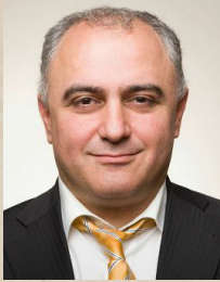
Հեղինակ՝ Միքայել Մինասյան

Սույն գիրական աշխատությունը հանդիսանում է Սփյուռք-Հայաստան-Արցախ կապերի հանրայնագիրության և հաղորդակցման գիրության տեսանկյուններից վերլուծության մի տեսություն: Այն առաջարկում է աշխարհասփյուռ հայության միասնության և փոխհամագործակցության կառույցային տարբերակներ քաղաքականության, տնտեսության և կրթամշակութային ոլորտներում: